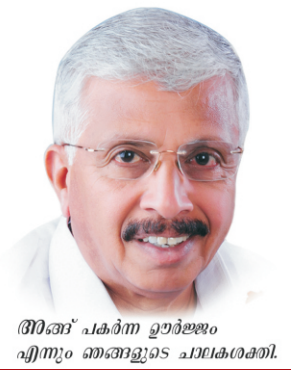
അഞ്ച് പകർന്ന ഉൾജ്ജം എന്തും ഞങ്ങളുടെ ചാലകശക്തി.

വി.പി. മരയ്ക്കാർ സ്മാരക മന്ദിരം - അംബുജവിലാസം റോഡ്, തിരുവനന്തപുരം >>> വിശേഷാൽ പതിപ്പ്