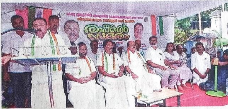
▶ കേരള ഇലക്ട്രിസിറ്റി എംപ്ലോയീസ് കോൺഫെഡറേഷൻ (ഐ.എൻ.ടി.യു.സി.) പട്ടം വൈദ്യുതി ഭവന മുനിൽ സംഘടിപ്പിച്ച രാപകൽ സമരം യു.ഡി.എഫ്. കൺവീനർ എം.എം.എസ് ഉദ്ഘാടനം ചെയ്യുന്നു

വർഷങ്ങളായി മുടങ്ങിക്കിടക്കുന്ന ഇലക്ട്രിസിറ്റി വർക്കർമാരുടെ പ്രമോഷൻ നടത്തുക, ജീവനക്കാരുടെ ഡി.എ. കൂടി