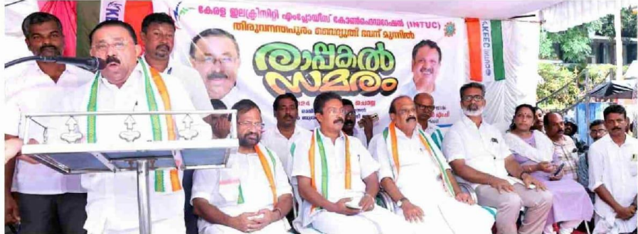
ഇലക്ട്രിസിറ്റി എംപ്ലോയീസ് കോൺഫെഡറേഷൻ വൈദ്യുതി ഭവന് മുനിൽ സംഘടിപ്പിച്ച രാപ്പകൽ സമരം യു.ഡി.എഫ് കൺവീനർ എം.എം. ഹസൻ ഉദ്ഘാടനം ചെയ്യുന്നു

ജീവനക്കാരുടെ ഡി.എ കൂടി തിക, ക്ഷാമബത്ത തുടങ്ങിയ