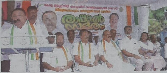
കേരള ഇലക്ട്രിസിറ്റി എംപ്ലോയീസ് കോൺഫെഡറേഷൻ പട്ടം വൈദ്യുതി ഭവൻ മുന്നിൽ സംഘടിപ്പിച്ച രാഷ്ട്രകർമ്മ സമരം യുഡിഎഫ് കൺവീനർ എം എം ഹസൻ ഉദ്ഘാടനം ചെയ്യുന്നു.

കേരള ഇലക്ട്രിസിറ്റി എംപ്ലോയീസ് കോൺഫെഡറേഷൻ (ഐഎൻടി യുസി) പട്ടം വൈദ്യുതി ഭവൻ മുന്നിൽ സംഘടിപ്പിച്ച