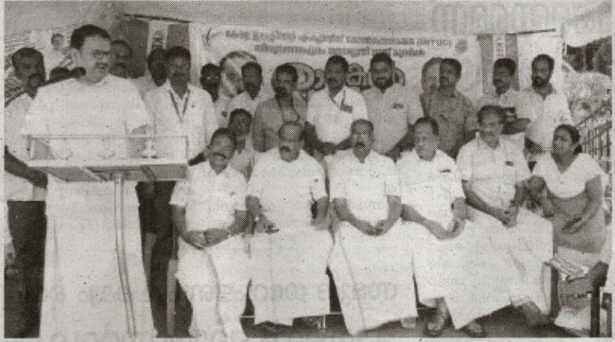
കേരള ഇലക്ട്രിസിറ്റി എംപ്ലോയീസ് കോൺഫെഡറേഷൻ (ഐഎൻസിയുസി) സംസ്ഥാന കമ്മിറ്റി തിരുവനന്തപുരം വൈദ്യുതി ഭവന് മുന്നിൽ സംഘടിപ്പിച്ച രാഷ്ട്രകൽ സമരത്തിന്റെ സമാപന യോഗം കെ മുരളീധരൻ എംപി ഉദ്ഘാടനം ചെയ്യുന്നു

തിരുവനന്തപുരം: യുഡിഎഫ് ഭരണകാലത്ത് ഒടുവിലുള്ള വൈദ്യുതി വാങ്ങൽ കരാർ റദ്ദാക്കി കൂടിയ വിലയ്ക്ക് വൈദ്യുതി വാങ്ങിയതിലൂടെ കെഎസ്ഇസ്സിക്ക് സാമ്പത്തിക നഷ്ടം വരുത്തിയതിന് പിന്നിലെ അഴിമതി അന്വേഷിച്ച് ഉത്തരവാദികളെ ശിക്ഷിക്കണമെന്ന് കെ.മുരളീധരൻ എംപി പ്രസ്താവിച്ചു. പീഎസ്സിയെ നോക്കുകുത്തിയാക്കി വിവിധ സ്ഥാപനങ്ങളിൽ സിപിഎം അനുഭാവികളെ കുത്തിനിറക്കുകയാണ്. ഘടകകക്ഷി മന്ത്രിയെ മുകസാക്ഷിയാക്കി സിപിഎമ്മിന്റേയും സിഐടിയുവിന്റേയും അജണ്ടകളാണ് വൈദ്യുതി ബോർഡിൽ നടപ്പിലാക്കുന്നത്. വൈദ്യുതോൽപ്പാദനം വർദ്ധിപ്പിക്കുവാൻ ആവശ്യമായ ക്രിയാത്മക നടപടികൾ സ്വീകരിക്കാത്ത കഴിഞ്ഞ ഏഴര വർഷത്തെ ഇടതുഭരണം തികഞ്ഞ പരാജയമായിരുന്നു. കേരള ഇലക്ട്രിസിറ്റി എംപ്ലോയീസ് കോൺഫെഡറേഷൻ (ഐഎൻസിയുസി) സംസ്ഥാന കമ്മിറ്റി തിരുവനന്തപുരം വൈദ്യുതി ഭവന് മുന്നിൽ സംഘടിപ്പിച്ച രാഷ്ട്രകൽ സമരത്തിന്റെ സമാപന യോഗം ഉദ്ഘാടനം ചെയ്യുകയായിരുന്നു അദ്ദേഹം.