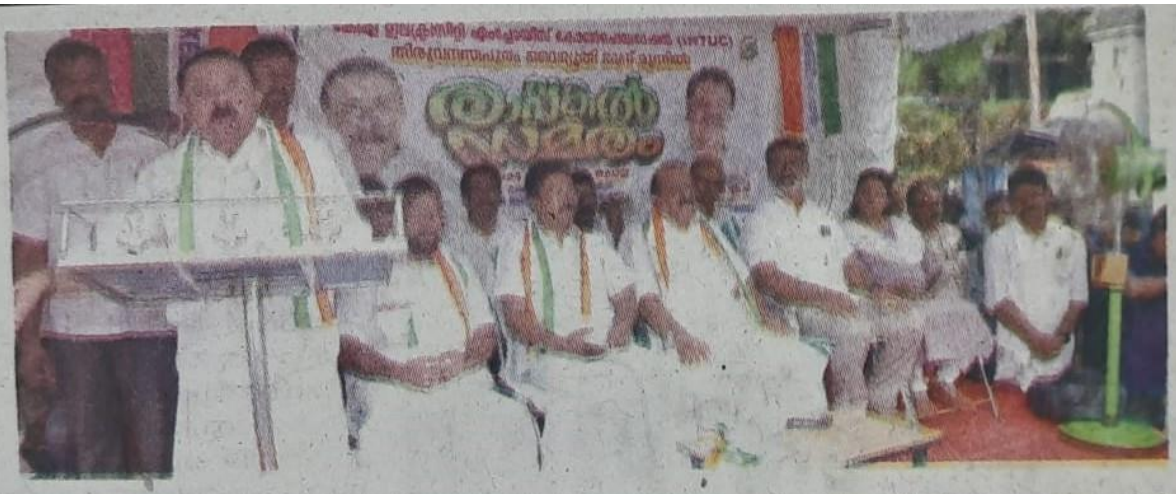
വർഷങ്ങളായി മുടങ്ങി കിടക്കുന്ന വർക്കർമാരുടെ പ്രമോഷൻ നടപ്പിലാക്കുക, അഴിമതിയും ധൂർത്തും മൂലം കടക്കണിയിലായ വൈദ്യുതി ബോർഡിന്റെ സാമ്പത്തിക സ്ഥിതിയുടെ ധവളപത്രം ഇറക്കുക, ക്ഷാമബത്ത കുടിശ്ശിക അനുവദിക്കുക തുടങ്ങിയ ആവശ്യങ്ങൾ ഉന്നയിച്ച് കേരള ഇലക്ട്രിസിറ്റി എംപ്ലോയീസ് കോൺഫെഡറേഷൻ (ഐ.എൻ.ടി.യു.സി.) പട്ടം വൈദ്യുതി ഭവനത്തിൽ സംഘടിപ്പിച്ച രാപകൽ സമരം യു.ഡി.എഫ് കൺവീനർ എം.എം.എം.എസ് ഉദ്ഘാടനം ചെയ്യുന്നു