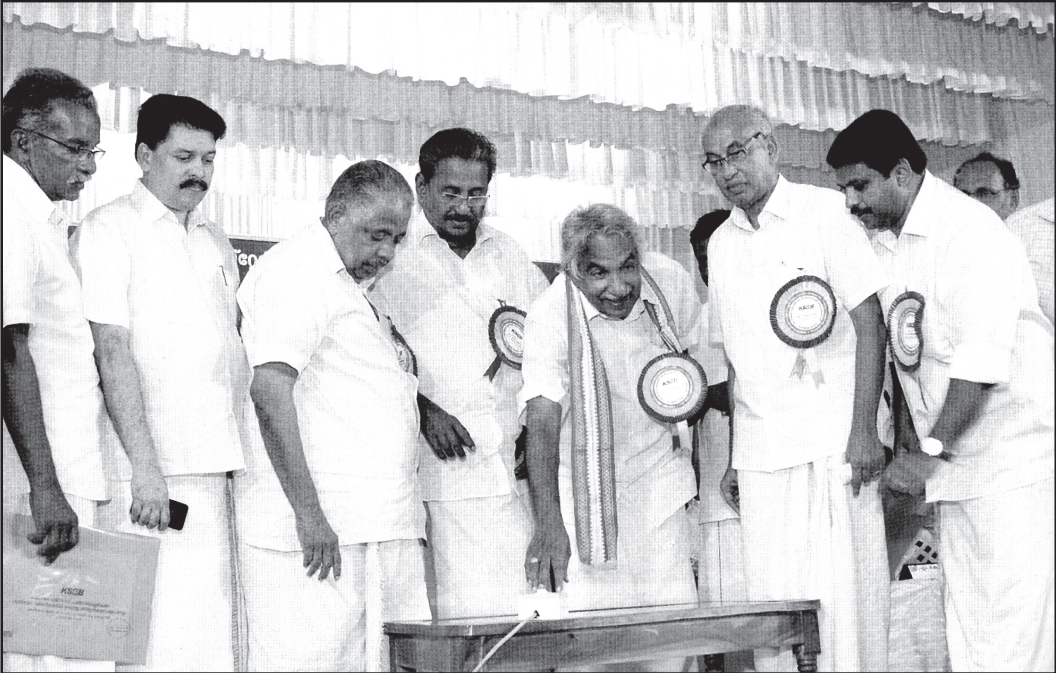
മലബാറിലെ സമ്പൂർണ്ണ വൈദ്യുതീകരണം: മുഖ്യമന്ത്രി ഉമ്മൻചാണ്ടി സിച്ച് ഓൺ ചെയ്യുന്നു

സബ്സ്റ്റേഷനുകൾ, രണ്ട് 66 കെവി സബ്സ്റ്റേഷനുകൾ, ഇരുപത്തിയൊന്ന് 33 കെവി സബ്സ്റ്റേഷനുകൾ ശേഷിവർദ്ധിപ്പിക്കലിലൂടെ.